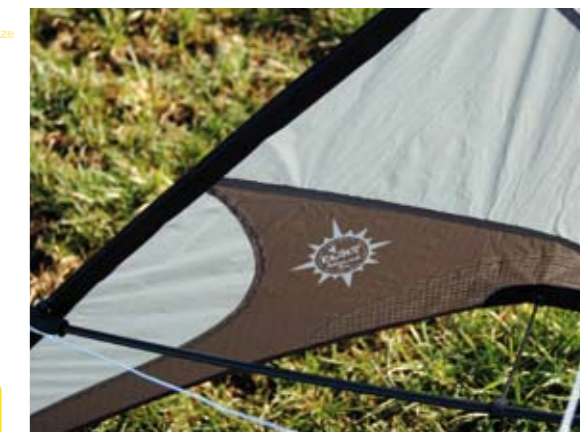
Saubere Näharbeiten soweit das Auge reicht

Zubehör: Stabiler Corduraköcher, Dyneemaleinen auf Winder (35 m/70 daN), Handschlaufen, Kielgewicht, Manual