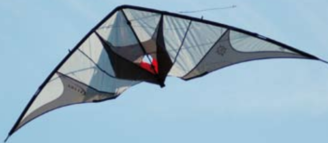
Trickreicher Elliot-Allrounder – hier in Rückenlage

zu quirlig. Das heißt jedoch nicht, dass er knackige Ecken nicht sehr wohl zu meistern in der Lage wäre. Nur bei schnellen, kurz aufeinanderfolgenden, zackigen Ecken schaukelt er sich etwas auf. Für ein Ballett ist seine Flugpräzision jedoch vollkommen ausreichend. Hier kann er saubere Geraden mit großen Loops, engen, wirbelnden Spins und präzisen Winkeln kombinieren.