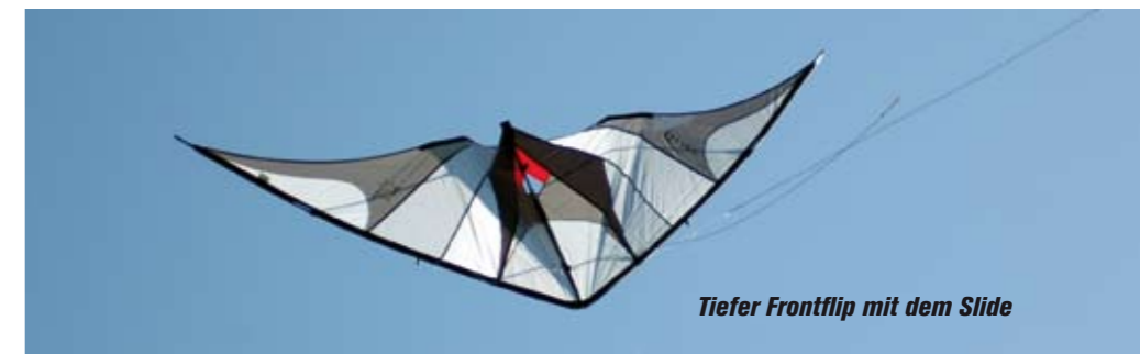
Tiefer Frontflip mit dem Slide

dann nur noch in Verbindung mit anstrengender Laufarbeit, doch Gestänge und Segel hielten klaglos.