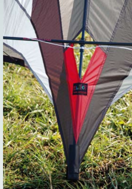
Markant: der Mittelkreuzbereich

Da sich die hier vorgestellte Version des Slide, die Competition-Variante, an anspruchsvollere Piloten wendet, besteht ihr Stabgerüst bis auf die obere Spreize durchgehend aus hochwertigem gewickelten CFK-Rohr . Man hat sich bei Elliot für