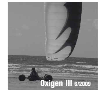
Oxigen III 6/2009