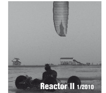
Reactor II 1/2010