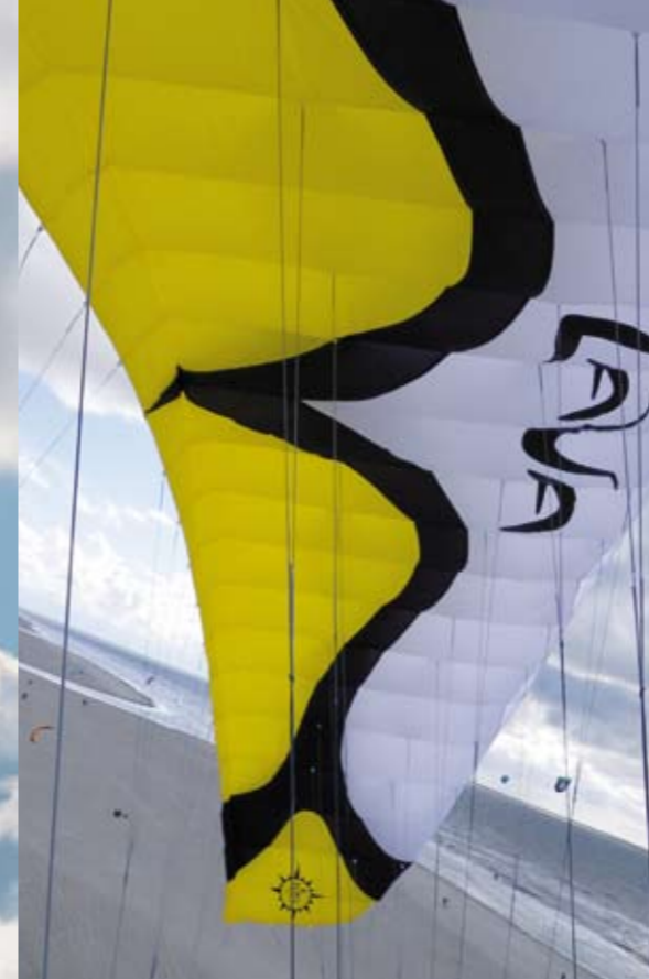
Die Lava in ihrem Element: hoch oben über dem Buggystrand (Foto mit Intervallfunktion der Pentax Optio W90)

Sofort sticht das wesentlich gefälligere Design der Lava II ins Auge. Die alte Segelaufteilung ließ den Kite noch kantiger wirken, als die Konstruktion aus dem Jahr 2007 es ohnehin schon war. Der 2010er-Nachfolger steht dagegen in Shape und Krümmung viel harmonischer in der Luft und braucht sich hinter Modellen aus der Gleitschirmentwicklung keinesfalls zu verstecken. Ganz enorm und in dieser Klasse einzigartig ist die Modell-Range der Lava II. Zwar sind die Abstände zwischen den Größen normal und sinnvoll, doch beginnt Elliot hier mit lediglich 1.1 Quadratmetern und endet beim achten Kite mit 10.2 Quadratmetern. Es gibt wohl keinen Wind, der damit nicht gut abgedeckt wäre. Gerade bei Sturm können die kleinen Lavas als Joker gelten (siehe dazu auch den Test der 1.5er Lava aus der ersten Serie in KITE & friends 6/2008 sowie das Video unter www.kite-and-friends.de ). Mit gut 10 Quadratmetern kann man bereits bei einer leichten Brise unterwegs sein, besonders, wenn man ein Leichtgewicht ist. Für das Wettrüsten in Buggyrennen jenseits von 10 Quadratmetern sind Intermediate wie die Lava sowieso nicht gedacht. So kamen