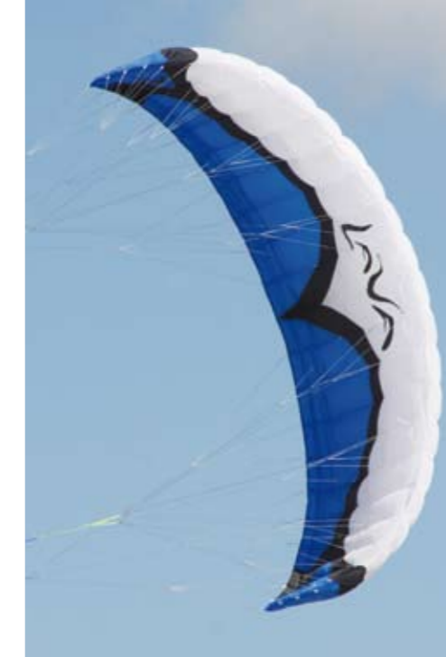
Ein moderner Kite von Elliot mit sauberer Rundung und gestreckter Form

Für jeden, der wirklich einen echten Intermediate möchte, denn gutes Handling bei anspruchsvollen Leistungen zeichnen die Lava aus. Dass sie bei Design und Verarbeitung auf aktuellem Stand ist, macht sie zusammen mit dem kompletten Lieferumfang und moderaten Preis zu einem unglaublich attraktiven Angebot.